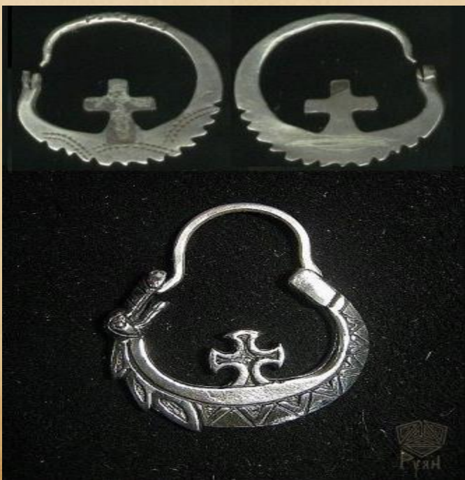
Мужская казачья серьга, крест попирающий змия, после турецкой войны