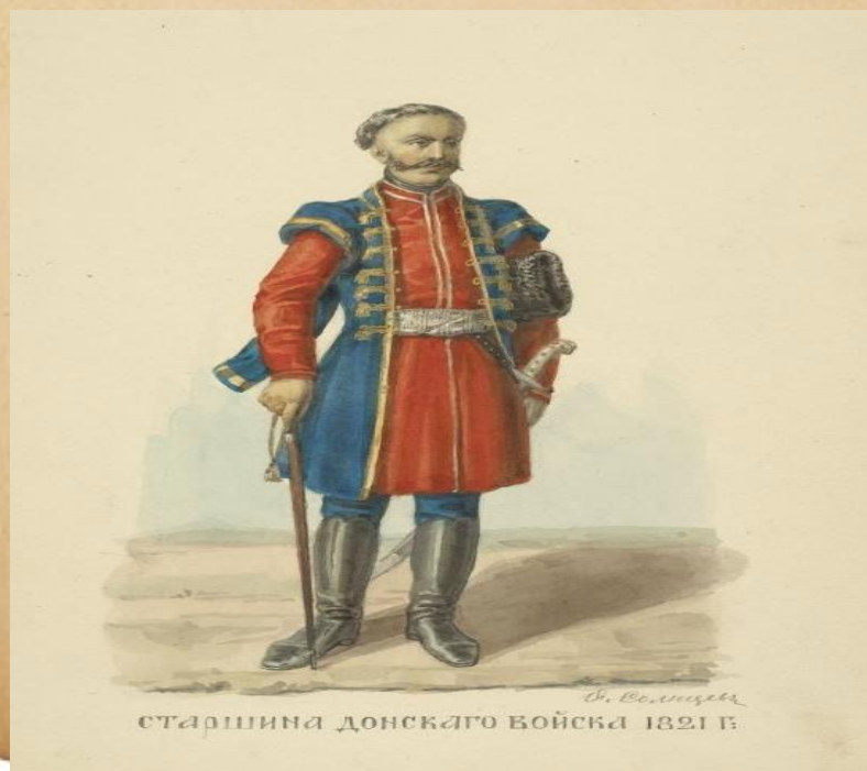
старшина донского войска 1821 г.

Старшина среди донских казаков выросла и развилась постепенно. Уже с половины XVII века «казаки стали не те: появилось богатство, а с ним роскошь и честолюбие». Люди, отличавшиеся умом, смелостью, распорядительностью, мало по малу подчинили себе остальных и захватили власть в свои руки, образовав из себя «знатных людей».