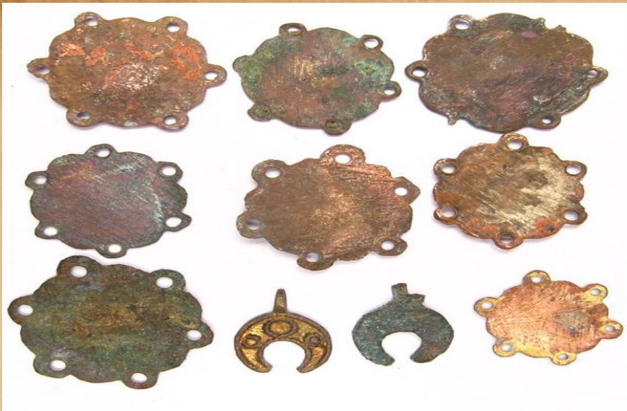
Женские Казачьи украшения