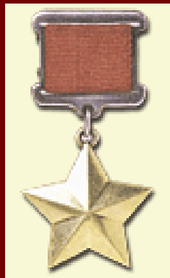
Медаль "Золотая Звезда"