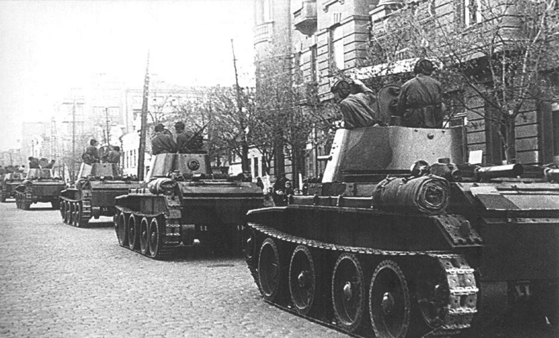
Колонна танков БТ-7 на Будёновском проспекте возле здания Горсовета (бывший дом Чирикова). Апрель или май 1942 года.