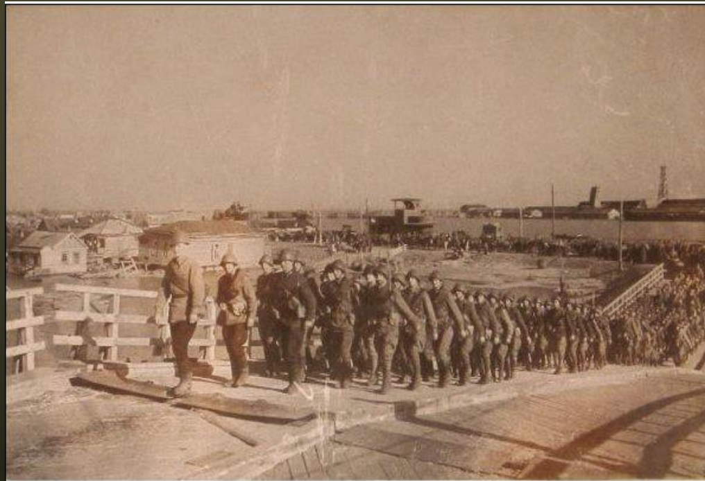
ЮЖНЫЙ ФРОНТ. НОЯБРЬ 1942 Г.

29 ноября после ожесточённых уличных боёв фашистские войска были выбиты из Ростова.