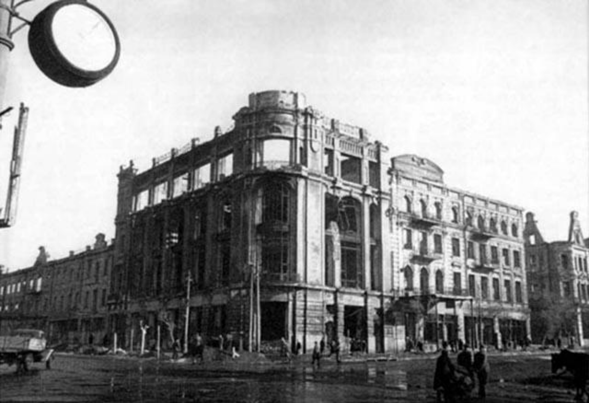
Ростов после освобождения в 1941 году