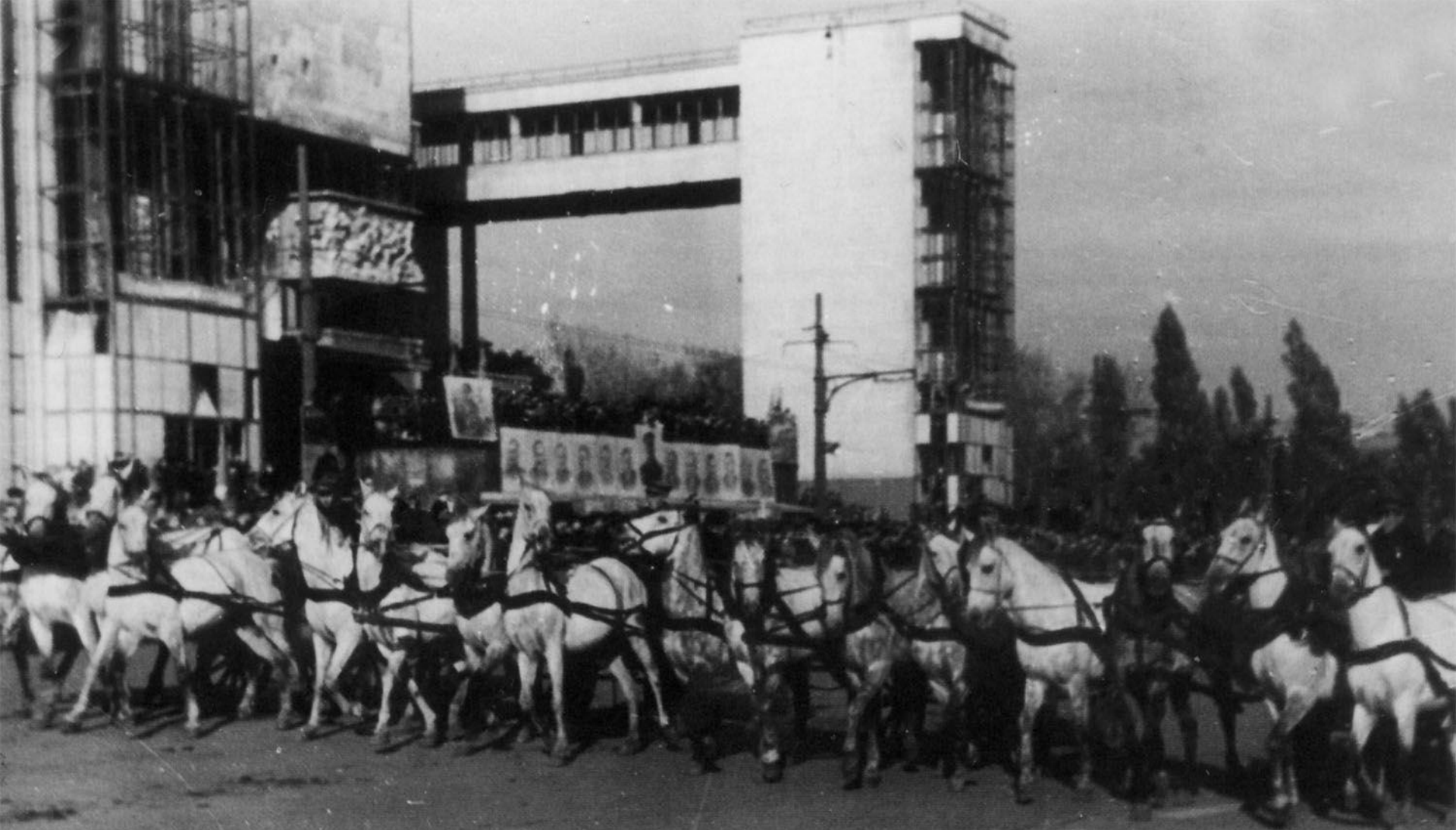
Парад победы в Ростове на Театральной площади 14 октября 1945 года.