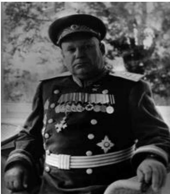
ШУМИЛОВ Михаил Степанович (1895-1975) генерал- полковник Герой Советского Союза