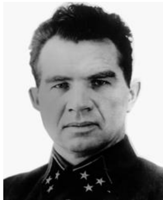
ЧУЙКОВ Василий Иванович (1900-1982) Маршал Советского Союза, дважды Герой Советского Союза