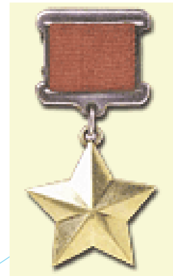
Медаль "Золотая Звезда"